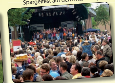
Spargelfest auf dem Martinusplatz