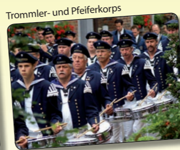
Trommler- und Pfeiferkorps