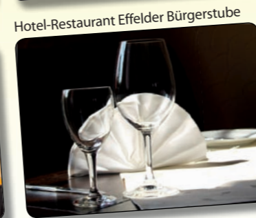
Hotel-Restaurant Effelder Bürgerstube