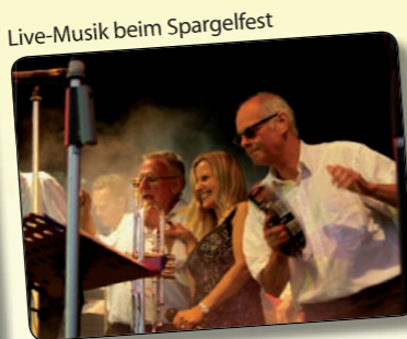
Live-Musik beim Spargelfest