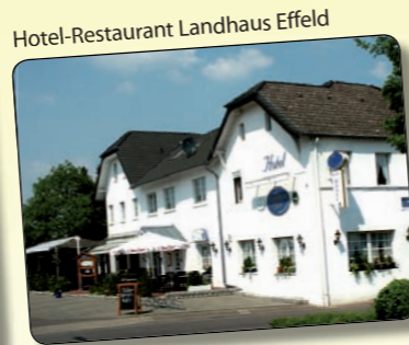
Hotel-Restaurant Landhaus Effeld