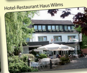
Hotel-Restaurant Haus Wilms